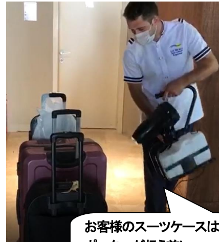
お客様のスーツケースは ポーターが扱う前に、 消毒作業が行われます