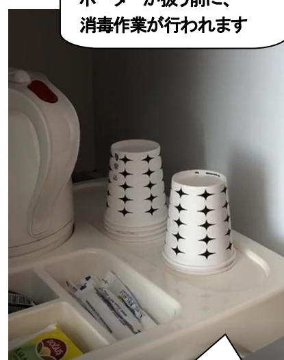
部屋の備品は使い捨ての 紙コップに変わりました