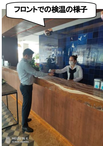
フロントでの検温の様子