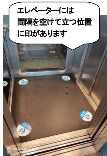
エレベーターには 間隔を空けて立つ位置 に印があります