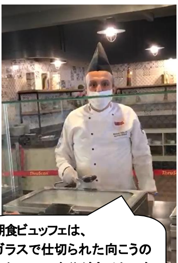
朝食ビュッフェは、 ガラスで仕切られた向こうの スタッフに、自分が食べたいも のを伝えて、盛ってもらうスタ イルに変わりました。