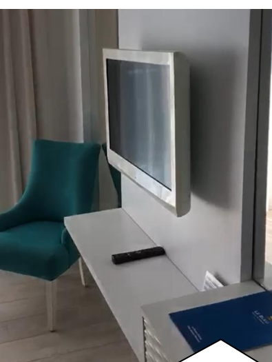
人々の接触する機会を減らすために、 テレビ周りのホテル案内の紙など、 不必要な備品は撤去されました。